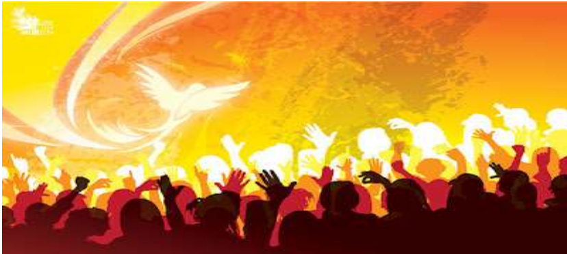
Pencurahan ROH TUHAN

"Kemudian dari pada itu akan terjadi, bahwa Aku akan mencurahkan Roh-Ku ke atas semua manusia, maka anak-anakmu laki-laki dan perempuan akan bernubuat ; orang-orangmu yang tua akan mendapat mimpi , teruna-terunamu akan mendapat penglihatan . Juga ke atas hamba-hambamu laki-laki dan perempuan akan Kucurahkan Roh-Ku pada hari-hari itu."