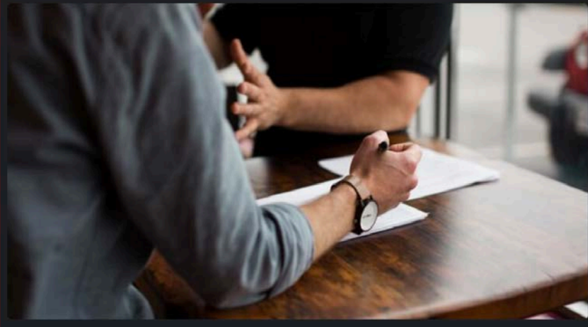
2. Tidak memihak teman atau lainnya