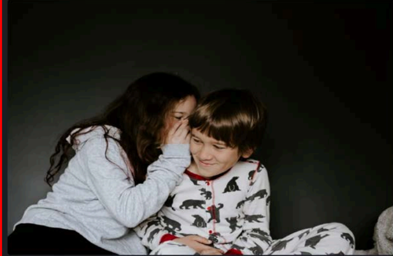
3. Tidak berbohong