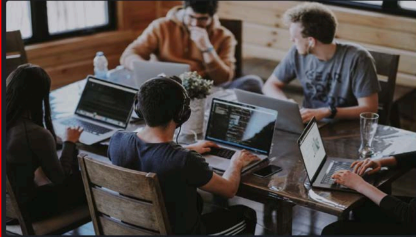
1. Semangat kerja yang tinggi