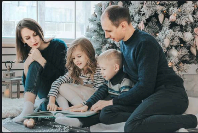
2. Saling menghargai dan menghormati