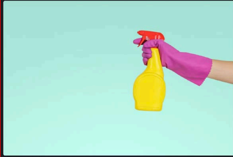
1. Menjaga kebersihan rumah